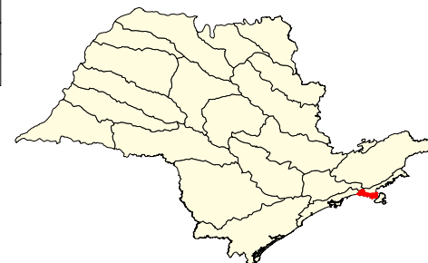
Localização no Estado de São Paulo Unidades de Gerenciamento dos Recursos Hídricos

* (em relação a área do município) área do município: 47.900 ha