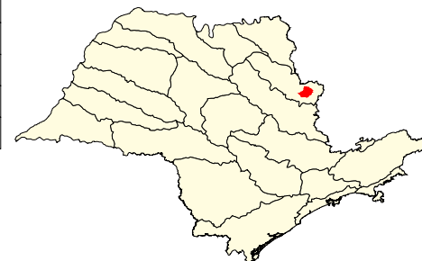
Localização no Estado de São Paulo Unidades de Gerenciamento dos Recursos Hídricos

* (em relação a área do município) área do município: 40.700 ha