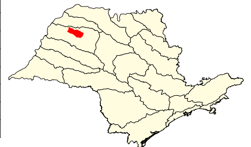
Localização no Estado de São Paulo Unidades de Gerenciamento dos Recursos Hídricos