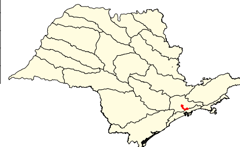
Localização no Estado de São Paulo Unidades de Gerenciamento dos Recursos Hídricos

* (em relação a área do município) área do município: 18.100 ha