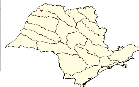
Localização no Estado de São Paulo Unidades de Gerenciamento dos Recursos Hídricos

* (em relação a área do município) área do município: 00.000 ha