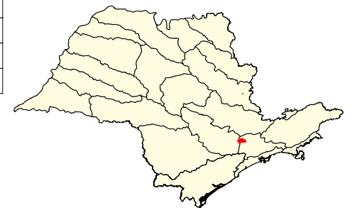
Localização no Estado de São Paulo Unidades de Gerenciamento dos Recursos Hídricos

* (em relação a área do município) área do município: 17.900 ha