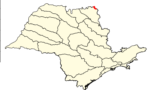
Localização no Estado de São Paulo Unidades de Gerenciamento dos Recursos Hídricos

* (em relação a área do município) área do município: 17.200 ha