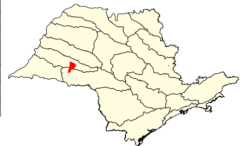
Localização no Estado de São Paulo Unidades de Gerenciamento dos Recursos Hídricos