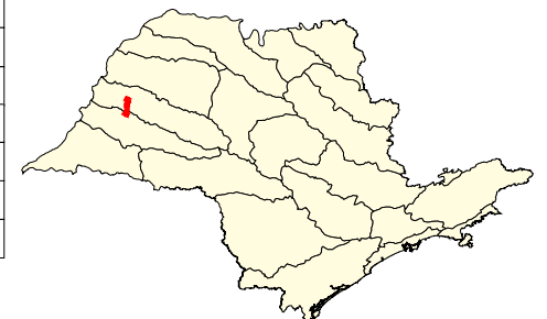
Localização no Estado de São Paulo Unidades de Gerenciamento dos Recursos Hídricos

* (em relação a área do município) área do município: 34.300 ha