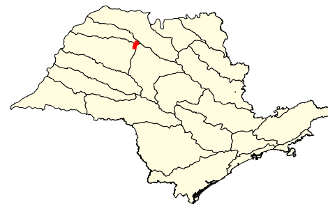
Localização no Estado de São Paulo Unidades de Gerenciamento dos Recursos Hídricos

* (em relação a área do município) área do município: 21.700 ha