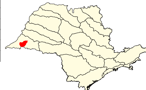
Localização no Estado de São Paulo Unidades de Gerenciamento dos Recursos Hídricos

* (em relação a área do município) área do município: 123.500 ha