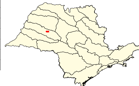
Localização no Estado de São Paulo Unidades de Gerenciamento dos Recursos Hídricos

* (em relação a área do município) área do município: 16.800 ha