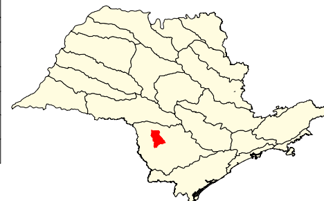
Localização no Estado de São Paulo Unidades de Gerenciamento dos Recursos Hídricos