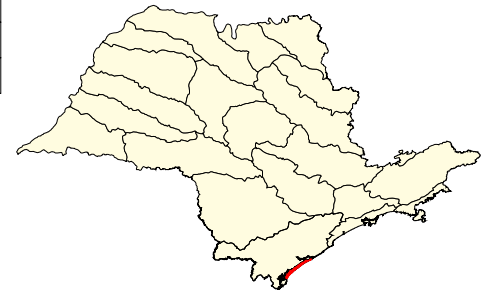
Localização no Estado de São Paulo Unidades de Gerenciamento dos Recursos Hídricos

* (em relação a área do município) área do município: 18.200 ha