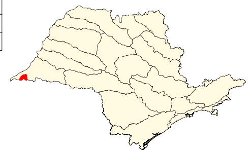
Localização no Estado de São Paulo Unidades de Gerenciamento dos Recursos Hídricos

* (em relação a área do município) área do município: 55.000 ha