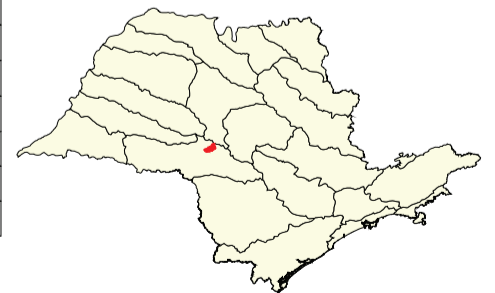
Localização no Estado de São Paulo Unidades de Gerenciamento dos Recursos Hídricos

* (em relação a área do município) área do município: 23.600 ha