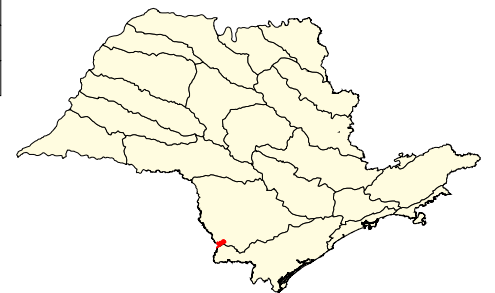
Localização no Estado de São Paulo Unidades de Gerenciamento dos Recursos Hídricos